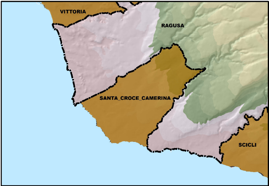
Tavola 9.6 - Alaggio natanti Punta Braccetto